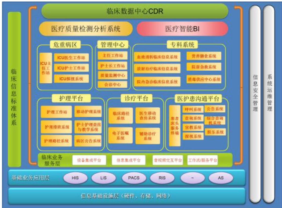
病区信息系统划分